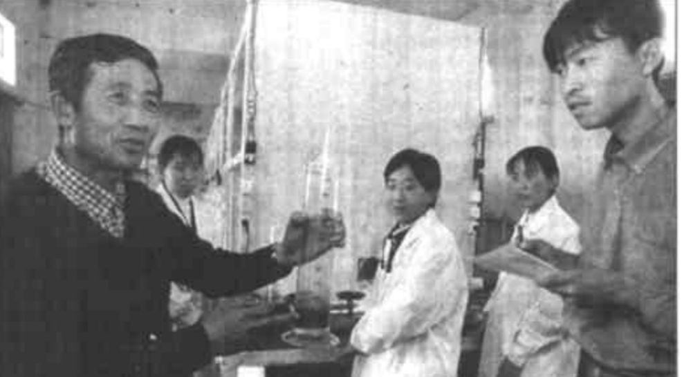
动物保健品厂落户东营

与科研单位成立技术经济联合体，共同开发高新技术产品。“育”，选派人员到大专院校、科研单位进修学习，培养自己的高层次技术管理人才。 智力的支持有力地促进了全县科技的进步，促进了产业的优化升级，进而促进了招商引资工作的进展。截至3月25日，全县已建成投产或正式营业的外来投资项目39个、在建项目41个，到位外来投资总额8704.9万元；已签订合同项目56个，合同外来投资总额10378万元，已签协议项目37个，协议外来投资总额4671万元。在谈项目202个。(杨同起 王学义)